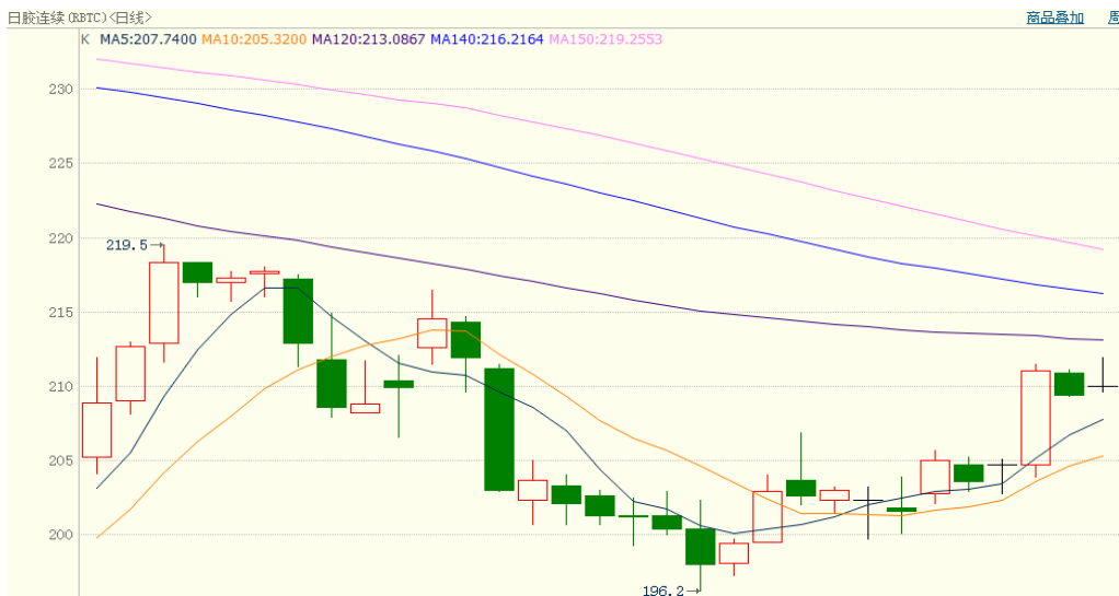
图 2、日胶连续 7 月 31 日行情走势