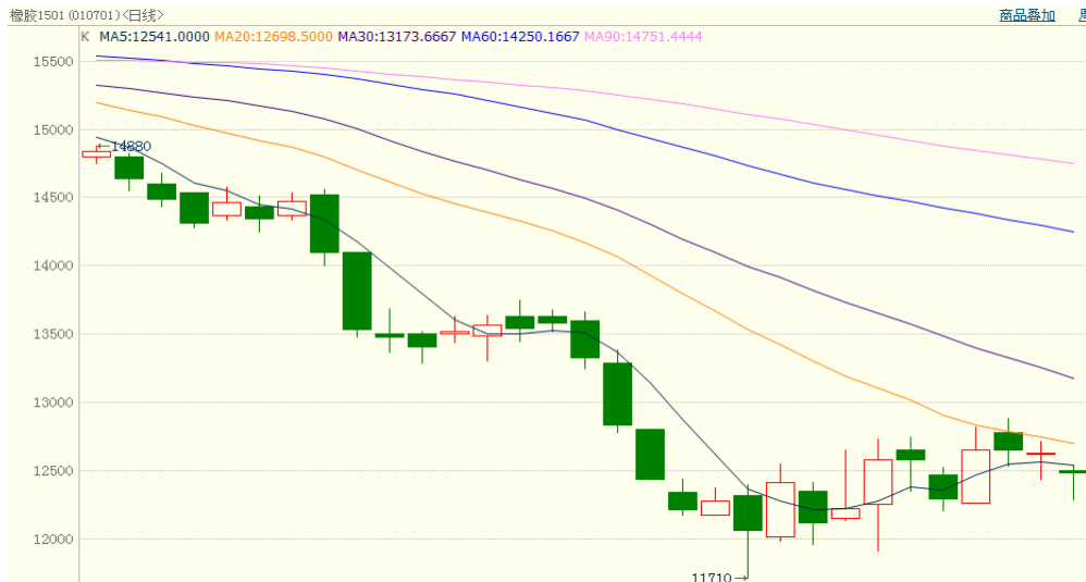
图 1、沪胶 1501 10 月 16 日行情走势