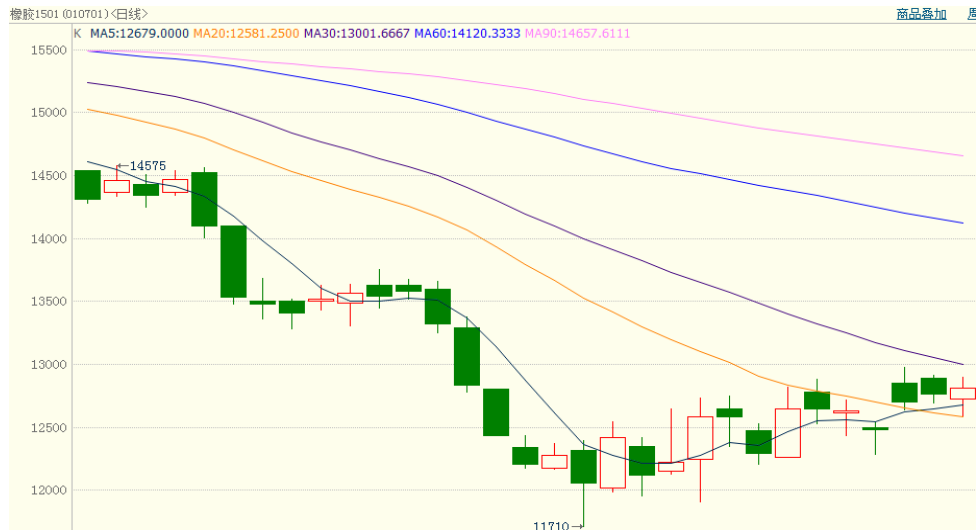
图 1、沪胶 1501 10 月 21 日行情走势