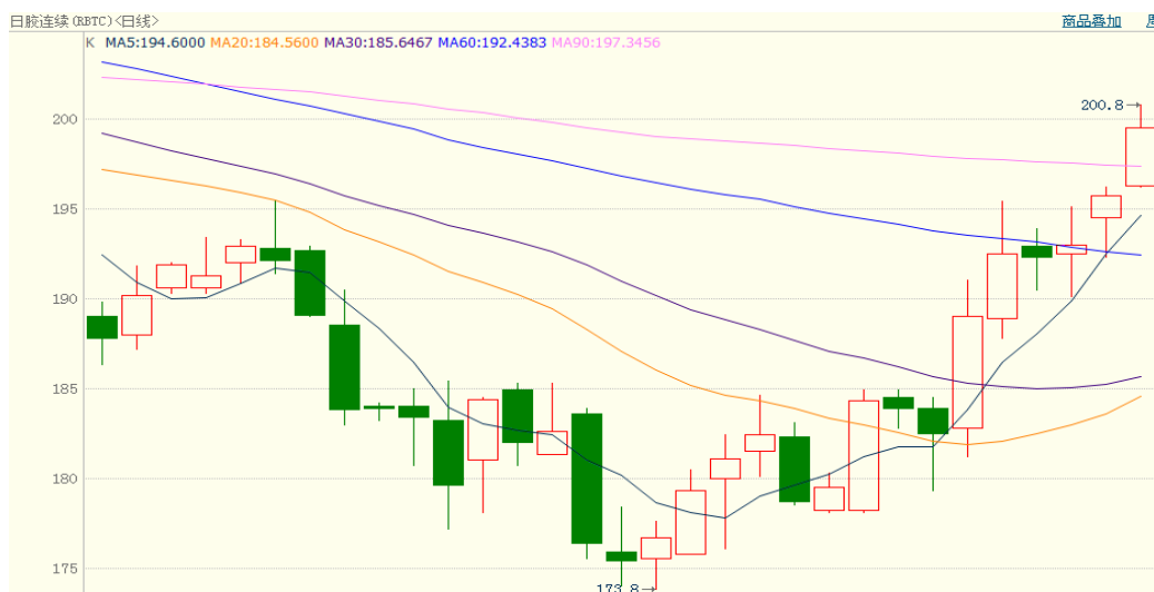
图 2、日胶连续 10 月 24 日行情走势