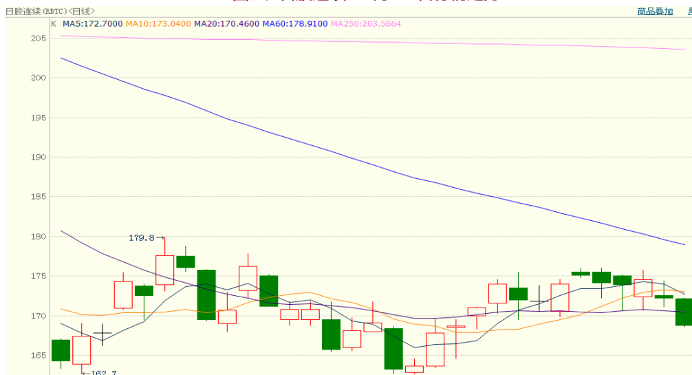
图 2、日胶连续 10 月 19 日行情走势